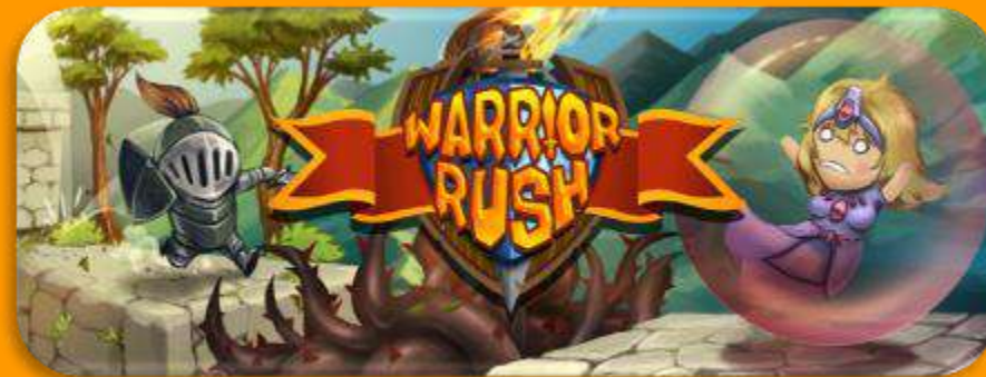
Warrior Rush Amazing Soul Games Studio

El sector ha mostrado un crecimiento dinámico en los últimos años, destacándose el aumento de las exportaciones de servicios, que han más que duplicado su valor entre 2021 y 2025, superando los USD 1.000 millones anuales.