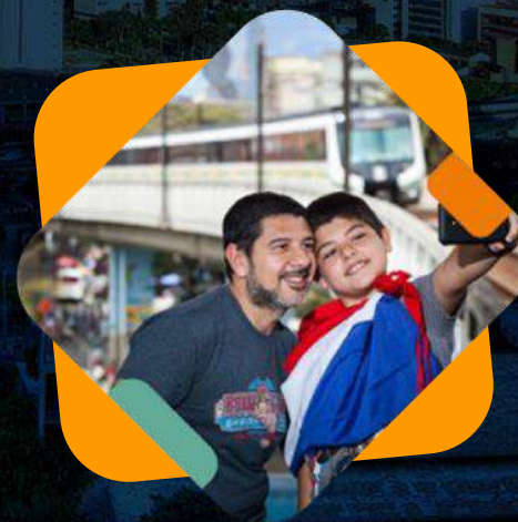
Calidez de su gente